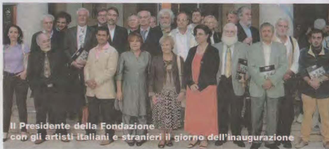
Il Presidente della Fondazione con gli artisti italiani e stranieri il giorno dell'inaugurazione

● Il 13 settembre è stata inaugurata la mostra "Arte senza confini" organizzata e promossa dalla Fondazione Ferrario e che fino al 26 ottobre vedrà esposte oltre 150 opere presso i tre Comuni di Vanzago, Pogliano e Pregnana Milanese. Non è la prima volta che la Fondazione Ferrario organizza eventi di vasta portata: è del 2001 la prima edizione dell'iniziativa, che univa Italia e Giappone attraverso la Pittura e la Scultura, aveva visto coinvolto solo il Comune di Vanzago; la nuova proposta culturale supera la precedente, anche in termini artistici: alla Pittura e alla Scultura si unisce questa volta la Poesia, in un percorso che elimina le barriere in nome della Cultura. Anche la musica, però si