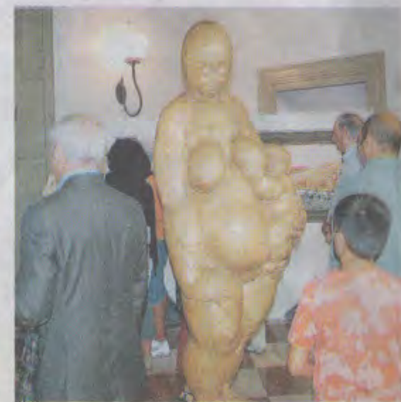
Gli artisti partecipanti alla mostra internazionale davanti a villa Ferrario e una delle sculture ospitate a Vanzago nella villa della Fondazione Ferrario